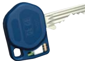
Mechatronischer Schlüssel mit Kaba Legic® Chip.

Ein besonderer Sicherheitsfaktor bei Kaba eologic ist, das verloren gegangene Schlüssel einfach aus der Berechtigung ausprogrammiert werden.